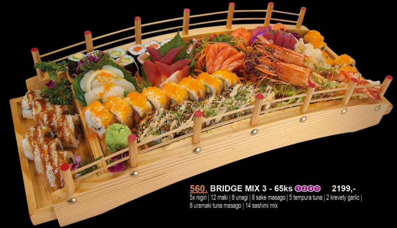
560. BRIDGE MIX 3 - 65ks 12300 2199,- 5x nigiri | 12 maki | 8 unagi | 8 sake masago | 5 tempura tuna | 2 krevety garlic | 8 uramaki tuna masago | 14 sashimi mix