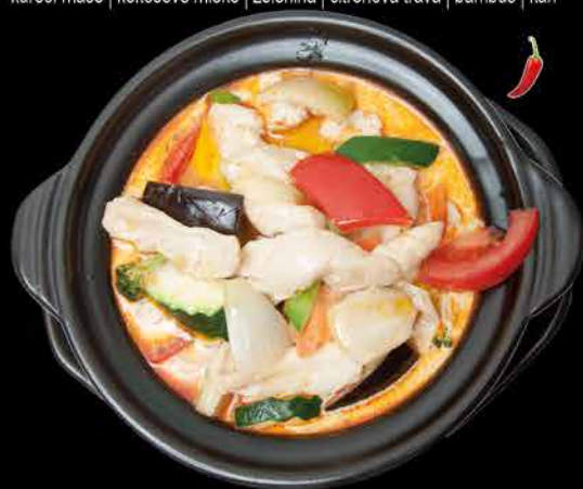
128. TORI THAI POT 7 165,- kuřecí maso | kokosové mléko | zelenina | citronová tráva | bambus | kari