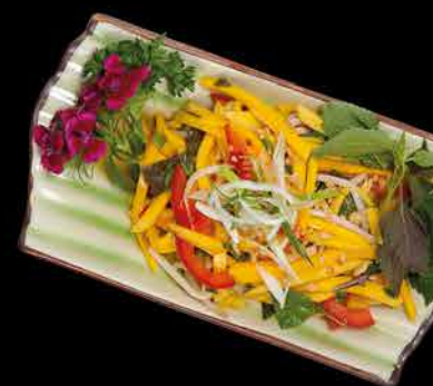
500. MANGO SALAD ⑥ 105,- mango | koriandr | arašidy | paprika