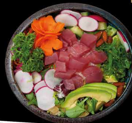
302. POKE BOWL MAGURO 209,- tunák | rýže | avokádo | salát | kešu | wakame