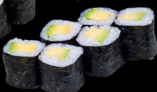
48. AVOKADO ⑩ 79,- avokádo | sezam