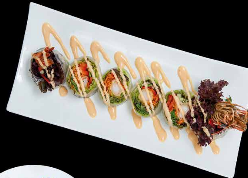
13. SHRIMPS ROLLS ④② 129,- krevety obalované | salát | okurka | paprika