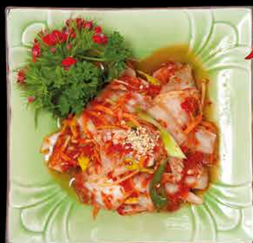
7. KIMMU CHI ⑩ 79,- čínské zelí | mrkev | porek | sezam