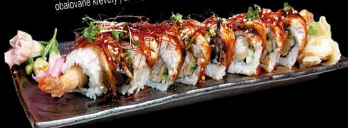
68. DRAGON ②④ 319,- obalované krevety | uhof | okurka