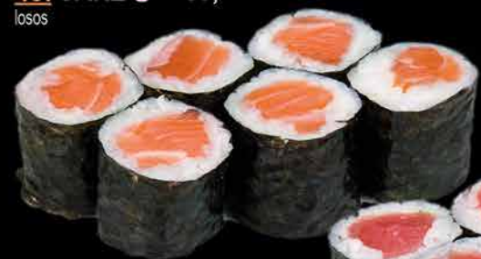
40. SAKE ④ 89,- losos