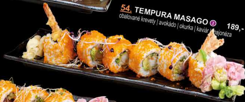
54. TEMPURA MASAGO ② 189,- obalované krevety | avokádo | okurka | kaviár | majonéza