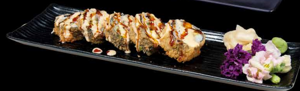
73. MAGURO ①③④ 189,- tuňák | avokádo | okurka