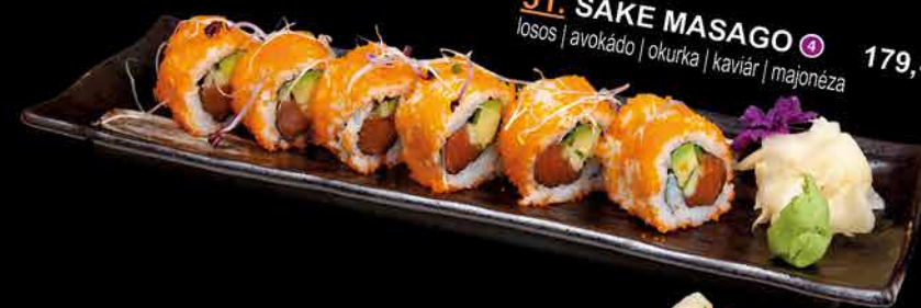
51. SAKE MASAGO ② 179,- losos | avokádo | okurka | kaviár | majonéza