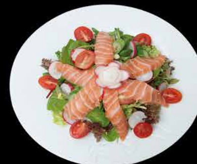
14. SASHIMI SAKE SALAD ④⑩ 159,- míchaný salát | plátky lososové sashimi