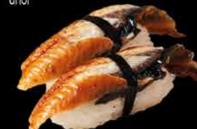
32. UNAGI 99,- úhoř