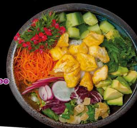
305. POKE BOWL TOFU 169,- tofu | rýže | avokádo | salát | kešu | wakame