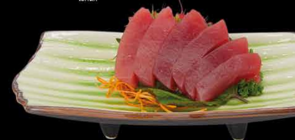
75. MAGURO - 6ks ④ 239,- tuňák