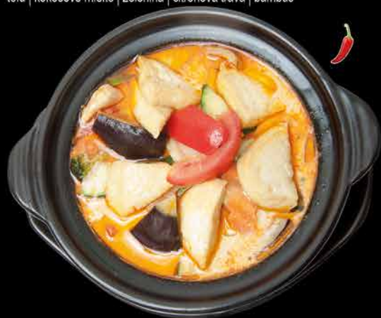
127. TOFU THAI POT 67 155,- tofu | kokosové mléko | zelenina | citronová tráva | bambus