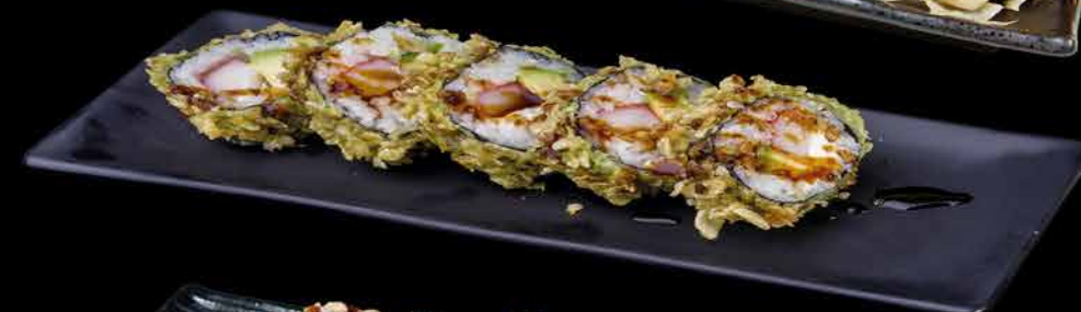
72. KANI ①②③ 159,- krab | avokádo | okurka | kaviár