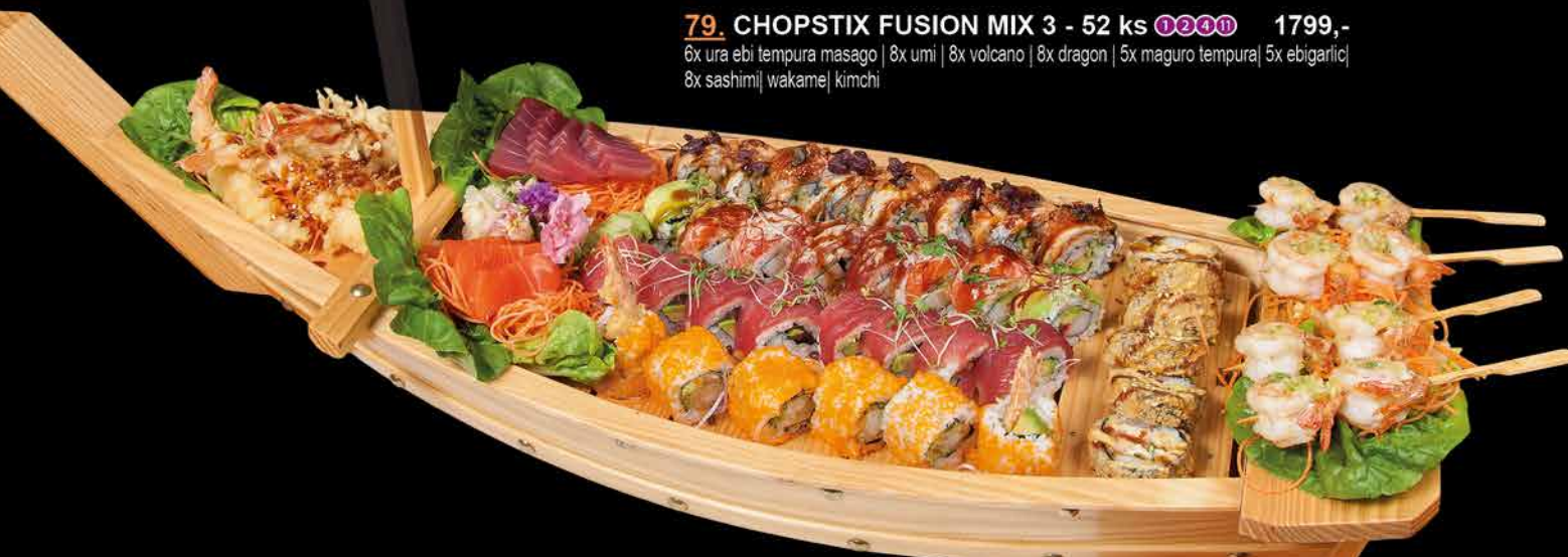
79. CHOPSTIX FUSION MIX 3 - 52 ks 12410 1799,- 6x ura ebi tempura masago | 8x umi | 8x volcano | 8x dragon | 5x maguro tempura | 5x ebigarlic | 8x sashimi | wakame | kimchi