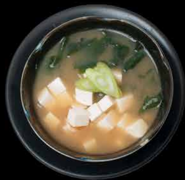
1. MISO TOFU ⑥ 49,- soja | mořská řasa | tofu | jarní cibulka