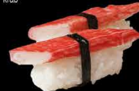
33. KANI 69,- krab