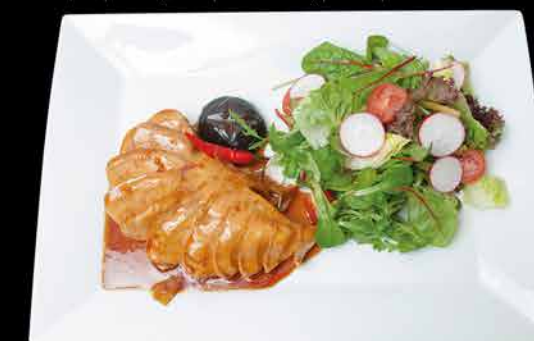
136. TORI STEAK TERIYAKI 11 189,- kuřecí prso | michaný salát | shitake houby | zázvor | čili