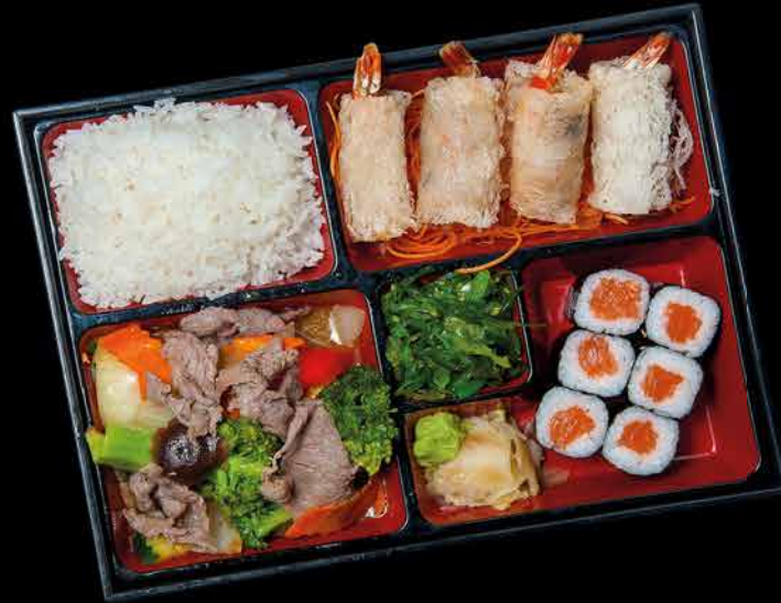
567. BEEF BENTO ①③④ 249,- hovězí maso | zelenina | 6 maki | 4 závitky | wakame salát | rýže