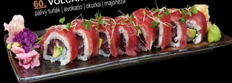
60. VOLCANO ④ 299,- páľivý tuňák | avokádo | okurka | majonéza