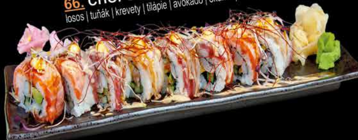
66. CHOPSTIX FUSION MIX ②④ 310,- losos | tuňák | krevety | tilápia | avokádo | okurka | majonéza