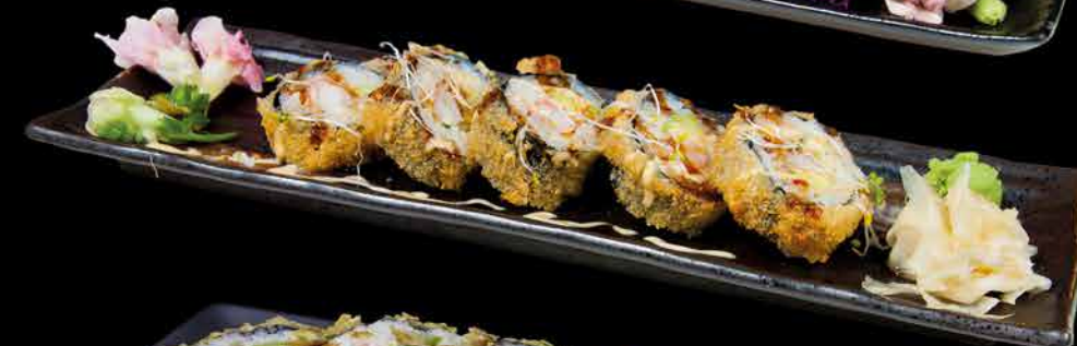
71. EBI ①②③ 179,- krevety | avokádo | okurka