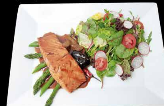
135. SAKE TERIYAKI 411 289,- losos | michaný salát | shitake houby | zázvor | čili