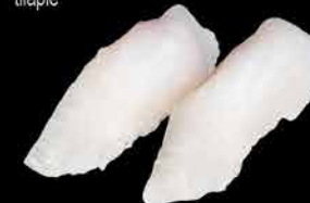
34. TAI 85,- tilapie