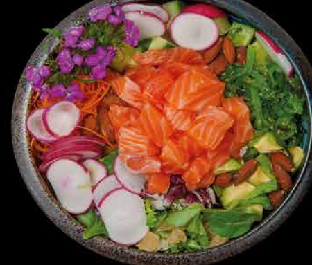
301. POKE BOWL SAKE 199,- losos | rýže | avokádo | salát | kešu | wakame