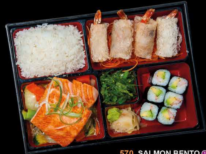
570. SALMON BENTO ①②④ 259,- grilovaný losos | zelenina | 6 maki | 4 závitky | wakame salát | rýže