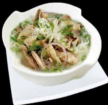
5. PHO GA MINI 65,- kuřecí maso | rýžové nudle | koriandr | sojové klíčky | jarní cibulka