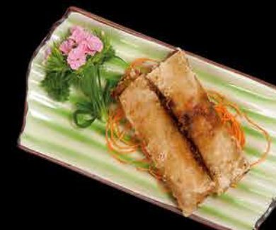
19. SMAŽENÉ ZÁVITKY 2KS 75,- vepřové maso | zeleniny | houby | rýžové nudle | vejce