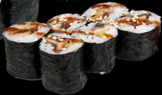
45. UNAGI KAPPA ④⑩ 99,- úhoř | okurka