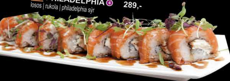
61. PHILADELPHIA ④ 289,- losos | rukola | philadelphia sýr