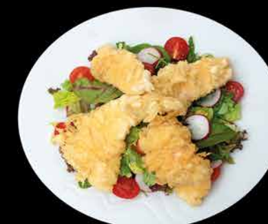
15. TORI TEMPURA SALAD ① 149,- míchaný salát | obalované kuřecí kousky