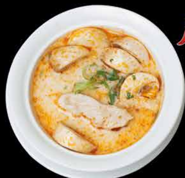
4. TOM KHA GAI ⑦ 69,- kuřecí maso | kokosová šťáva | houby | koriandr | citrónová tráva | jarní cibulka