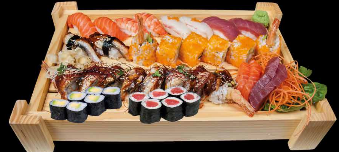
81. BRIDGE MIX 2 - 40 ks 2410 1299,- 10x nigiri | 12 maki | 8x dragon | 6x ura ebi tempura | 4x sashimi