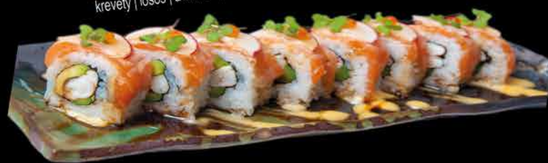
64. NATSUMI ②④ 289,- krevety | losos | avokádo | okurka | majonéza