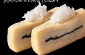
36. TAMAGO 69,- japonská omeleta | sezam