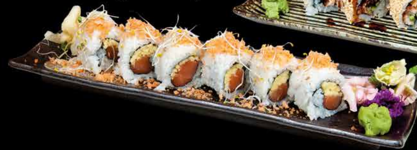
57. SAKE MANGO ④ 179,- losos | mango | sušený losos