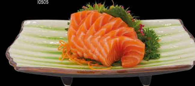
74. SAKE - 6ks ④ 209,- losos