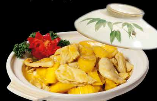
139. MANGO GAI 139,- kuřecí maso | broskev | mango | kokosová šťáva