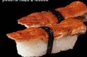
37. KAWA 75,- pečená kůže z lososa