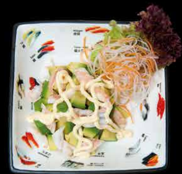
10. EBI AVOKADO ④⑦ 89,- avokádo | krevety | majonéza