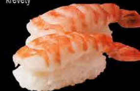
31. EBI 90,- krevety