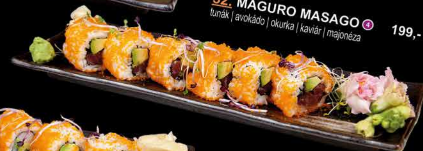
52. MAGURO MASAGO ④ 199,- tuňák | avokádo | okurka | kaviár | majonéza