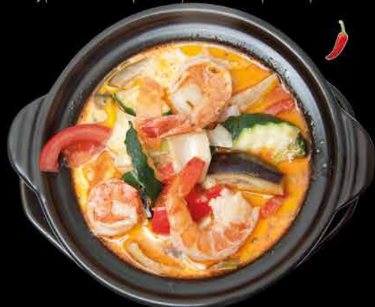
131. EBI THAI POT 27 169,- krevety | kokosové mléko | zelenina | citronová tráva | bambus | kari