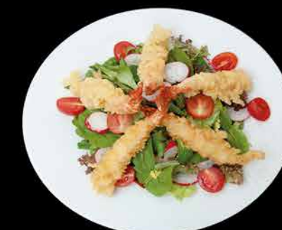
16. EBI TEMPURA SALAD ①② 169,- lehký míchaný salát | ebi tempura