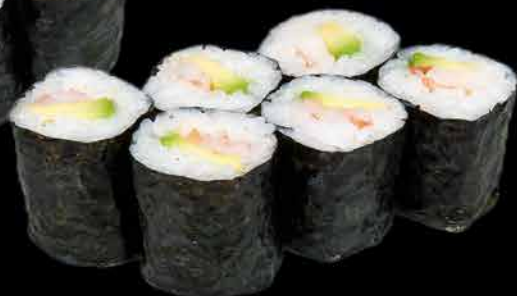
42. EBI AVOKADO ② 89,- krevety | avokádo