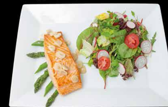
134. SAKE BATA YAKI 4 279,- losos | michaný salát | salát | česnek | máslo