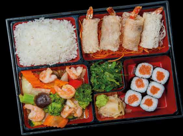
568. SHRIMPS BENTO ①③④ 249,- krevety | zelenina | 6 maki | 4 závitky | wakame salát | rýže