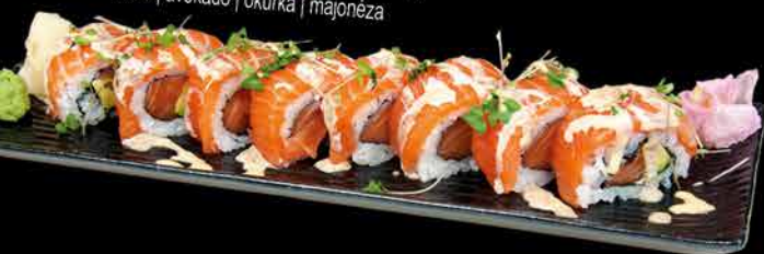
59. SALMON ④ 249,- losos | avokádo | okurka | majonéza