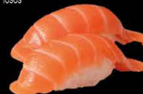
29. SAKE 90,- losos