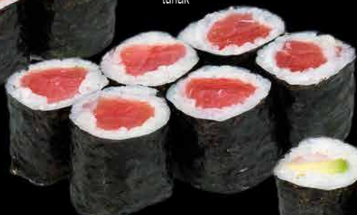
41. MAGURO ④ 99,- tuňák