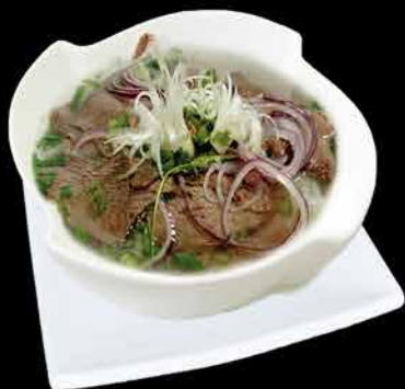
6. PHO BO MINI 69,- hovězí maso | rýžové nudle | koriandr | sojové klíčky | jarní cibulka