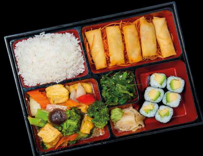
569. TOFU BENTO ①⑥⑩ 209,- tofu | zelenina | 6 maki | 5 vege závitky | wakame salát | rýže