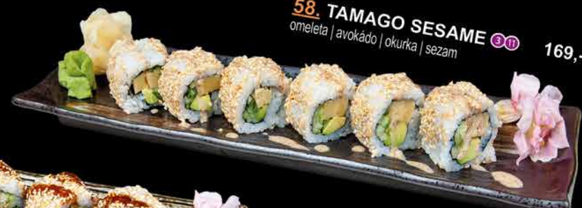
58. TAMAGO SESAME ③⑩ 169,- omeleta | avokádo | okurka | sezam