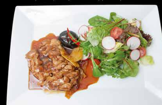
137. TORI LEGS TERIYAKI 11 189,- kuřecí stehno | michaný salát | shitake houby | zázvor | čili