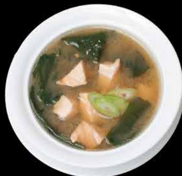
2. MISO SAKE ④⑥ 59,- soja | mořská řasa | losos | jarní cibulka