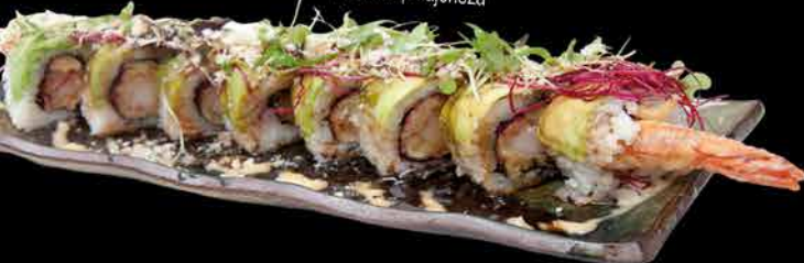
63. EBISU ② 289,- obalované krevety | avokádo | okurka | majonéza