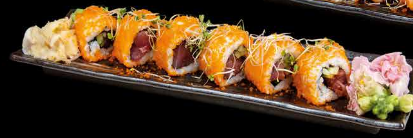
55. SPICY MAGURO ② 199,- pálivý tuňák | okurka | kaviár