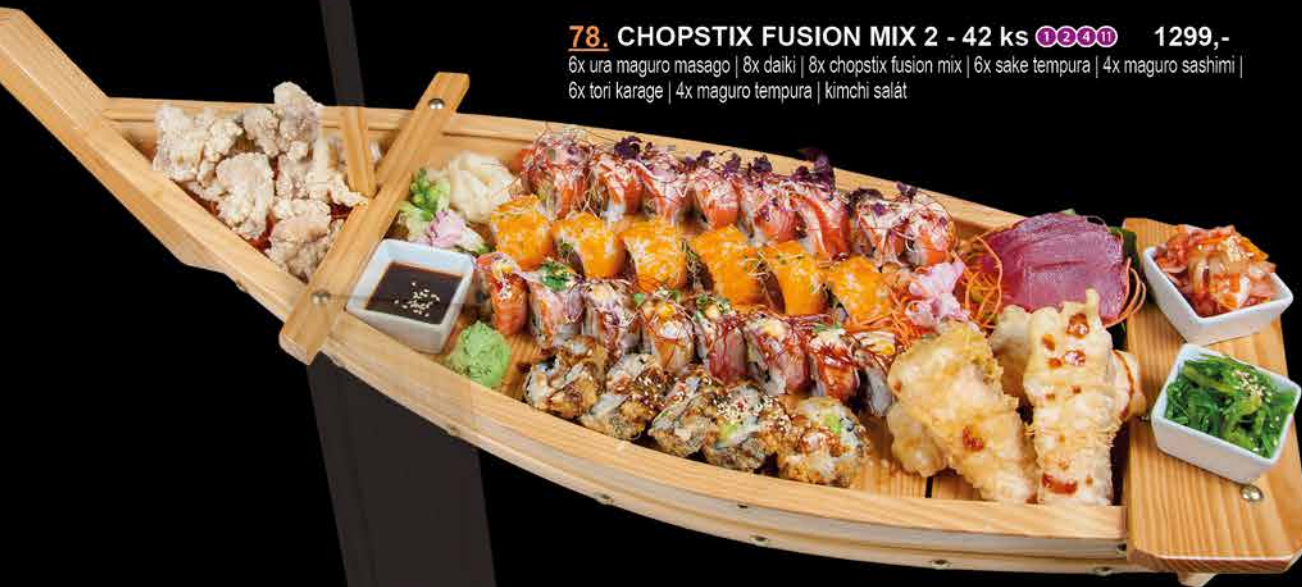
78. CHOPSTIX FUSION MIX 2 - 42 ks 13300 1299,- 6x ura maguro masago | 8x daiki | 8x chopstix fusion mix | 6x sake tempura | 4x maguro sashimi | 6x tori karage | 4x maguro tempura | kimchi salát