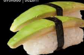
35. AVOKADO 75,- avokádo | sezam