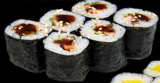
46. KAWA ④⑩ 79,- pečená kůže z lososa | okurka | sezam