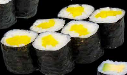
47. OSHINKO ⑩ 69,- ředkev | sezam