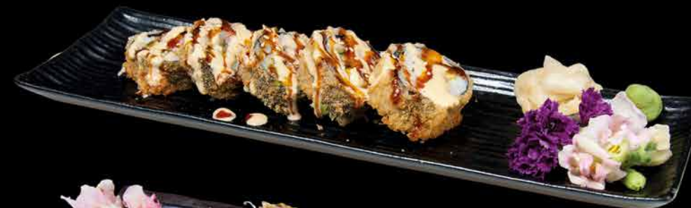
70. SAKE ③④ 179,- losos | avokádo | okurka