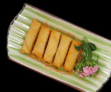
18. VEGETARIÁNSKÉ ZÁVITKY 5KS ① 69,- mango | koriandr | arašidy | paprika | okurka