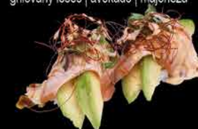
38. SAKE ABURI 110,- grilovaný losos | avokádo | majonéza