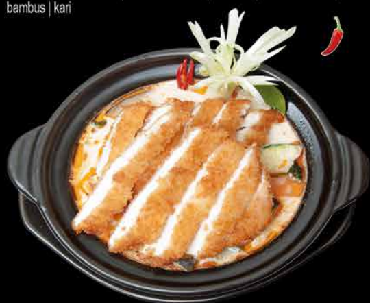
129. TORI FURAI THAI POT 17 169,- obalované kuřecí maso | kokosové mléko | zelenina | citronová tráva | bambus | kari