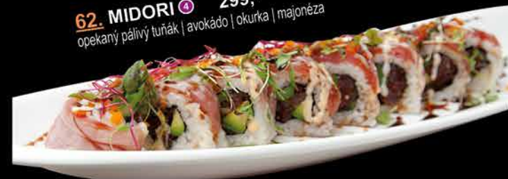
62. MIDORI ④ 299,- opekaný páľivý tuňák | avokádo | okurka | majonéza