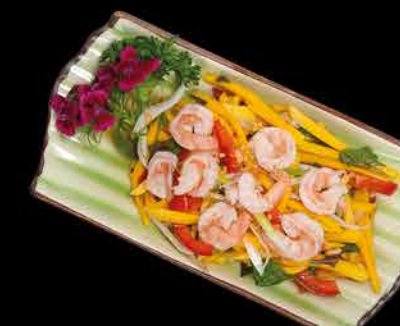
501. EBI MANGO SALAD ② 125,- krevety | mango | koriandr | arašidy | paprika