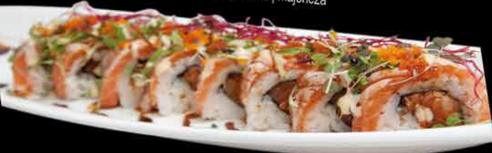
65. DAIKI ④ 299,- opekaný páľivý losos | avokádo | okurka | majonéza