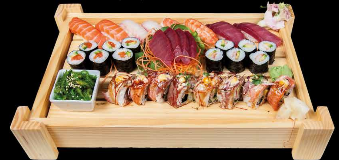
80. BRIDGE MIX 1 - 28 ks 2410 799,- 8x nigiri | 12 maki | 8x midori