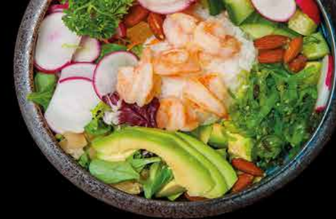
303. POKE BOWL EBI 199,- krevety | rýže | avokádo | salát | kešu | wakame