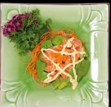
9. SAKE AVOKADO ④⑦ 89,- avokádo | losos | majonéza