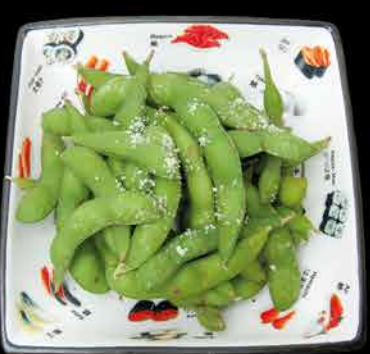
12. EDAMAME ① 89,- vařené sojové boby