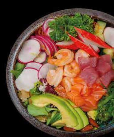
304. POKE BOWL MIX 209,- losos | tunák | krevety | rýže | avokádo | salát | kešu | wakame