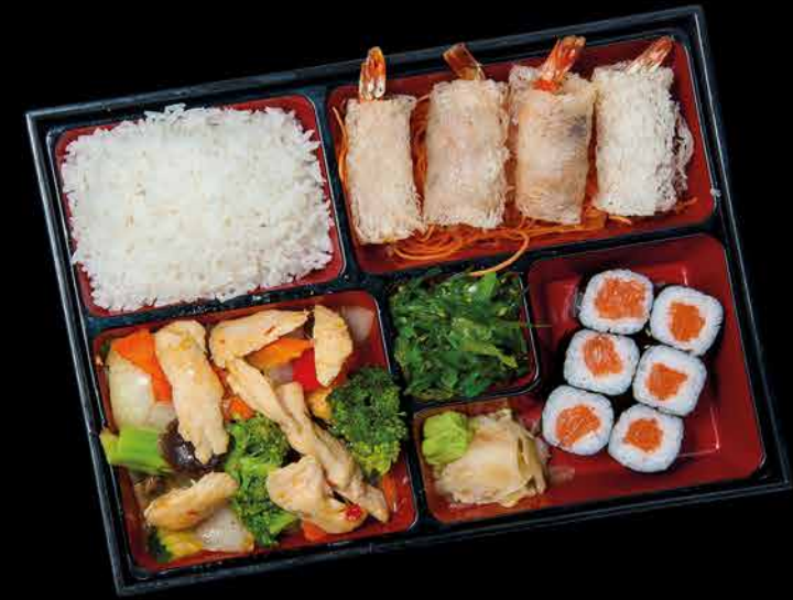
566. CHICKEN BENTO ①②④ 229,- kuřecí maso | zelenina | 6 maki | 4 závitky | wakame salát | rýže