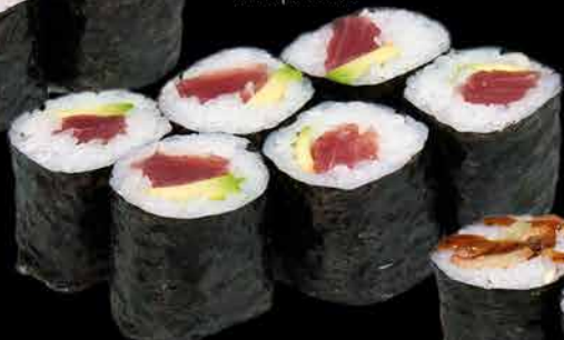
44. MAGURO AVOKADO ④ 99,- tuňák | avokádo