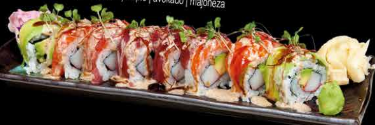
67. UMI ②③ 299,- losos | tuňák | krab | tilápia | avokádo | majonéza