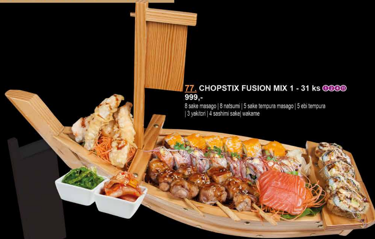
77. CHOPSTIX FUSION MIX 1 - 31 ks 12300 999,- 8 sake masago | 8 natsumi | 5 sake tempura masago | 5 ebi tempura | 3 yakitori | 4 sashimi sake | wakame