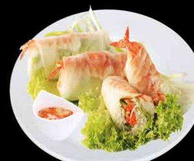
17. JARNÍ ZÁVITKY 2KS ② 89,- krevety (hovězí) | vejce | surimi | rýžové nudle | salát