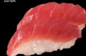
30. MAGURO 99,- tuňák