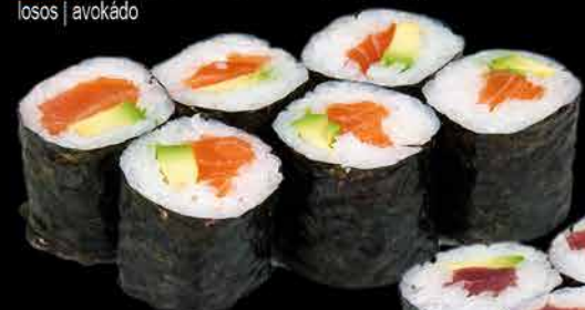
43. SAKE AVOKADO ④ 89,- losos | avokádo