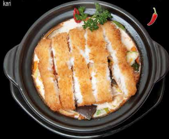
130. SALMON THAI POT 147 169,- obalovaný losos | kokosové mléko | zelenina | citronová tráva | bambus | kari