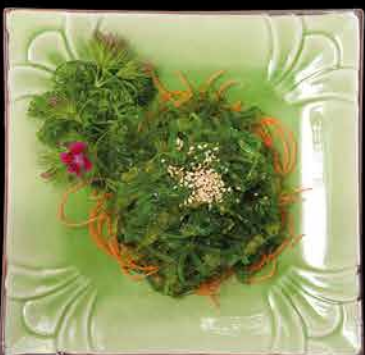
8. WAKAME SALADS ⑩ 89,- mořské řasy | sezam