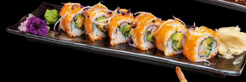
53. EBI MASAGO ② 179,- krevety | avokádo | okurka | kaviár | majonéza