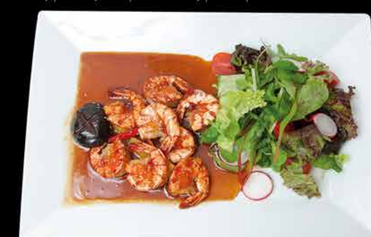
138. EBI TERIYAKI 211 229,- krevety | michaný salát | shitake houby | zázvor | čili