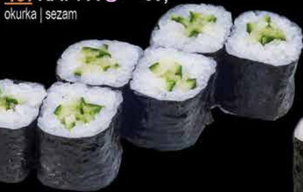
49. KAPPA ⑩ 69,- okurka | sezam