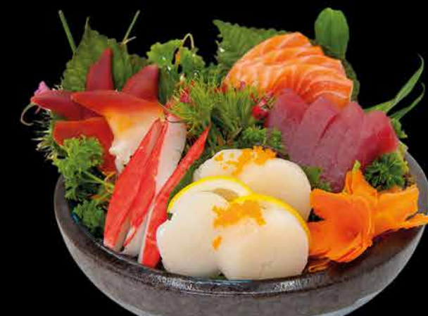
76. SASHIMI MIX - 20ks ②④ 569,- 4 losos | 4 tuňák | 4 krab | 4 hokigai | 4 hotategai