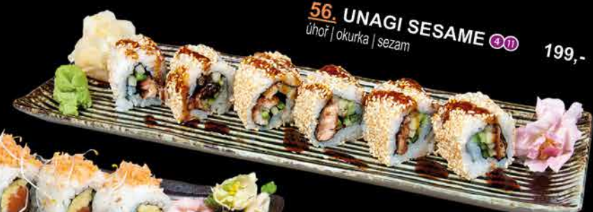
56. UNAGI SESAME ④⑩ 199,- úhoř | okurka | sezam