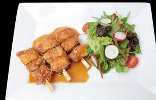
133. YAKI TORI 3ks 11 189,- kuřecí maso | michaný salát