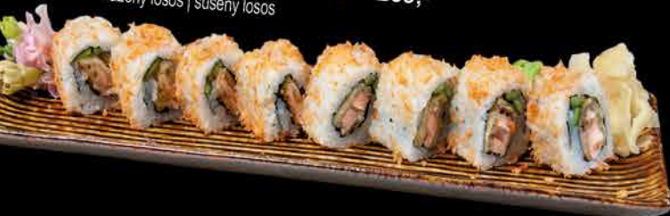
69. SAKE SAMURAI ④ 269,- smažený losos | sušený losos