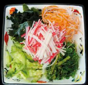
11. CHUKA WAKAME ④⑩ 89,- salát | surimi | mořské řasy | okurka | sezam