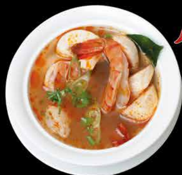
3. TOM YANG GUNG ② 79,- krevety | citrónová tráva | koriandr | houby | jarní cibulka